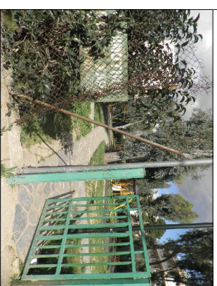
ΦΩΤΟΓΡΑΦΙΕΣ ΥΦΙΣΤΑΜΕΝΗΣ ΚΑΤΑΣΤΑΣΗΣ